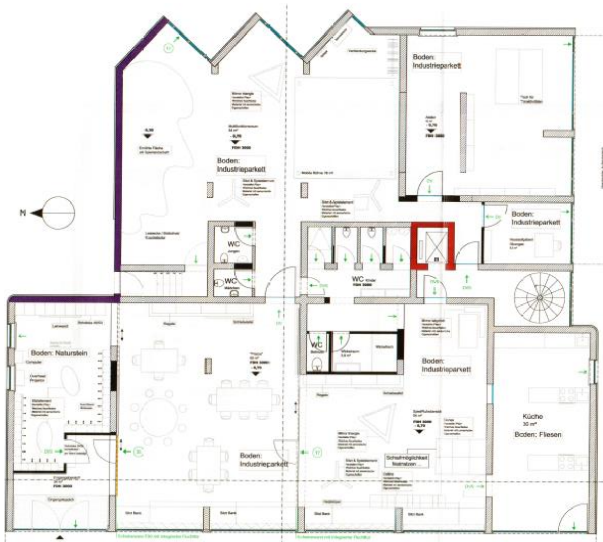
Abbildung 2 Kita